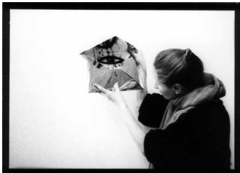
„Magische Korrespondenz“, eine von der Raumdecke abgehängte Reihe mit spiegelnden Briefcouverts

September „o. T. – wer die Wahl hat“, GEDOK-Ausstellung in der Pyramide in Berlin-Hellersdorf (Teilnahme mit einer Installation)