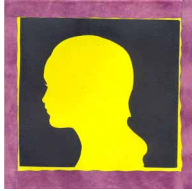
„Menschen wie Du und ich“

Oktober „Der Spiegel - Alles ist unsterblich“, Ausstellung zu Andrej Tarkowskij's Film ‚Der Spiegel‘ im Kunstbahnhof Dresden (Teilnahme mit einer Installation)