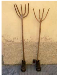
„Die Wächter des Hauses“, Garderobenständer aus alten Arbeitsschuhen und traditionellen Heugabeln

„Furnish Me“, internationaler Design-workshop in Llorenç del Penedès/Spanien (Teilnahme mit vor Ort entstandenen Möbelobjekten) > www.casamarles.org < siehe Projekte