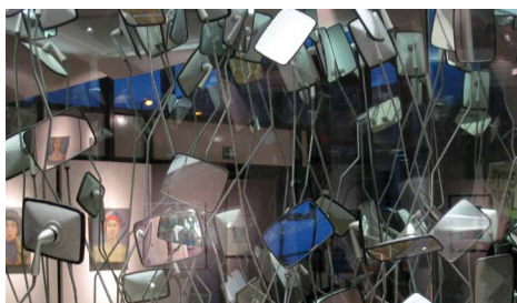
„Gewächshaus“, Installation mit Trabant Rückspiegeln in Glasvittrinen

September „o. T. – wer die Wahl hat“, GEDOK-Ausstellung in der Pyramide in Berlin-Hellersdorf (Teilnahme mit einer Installation)